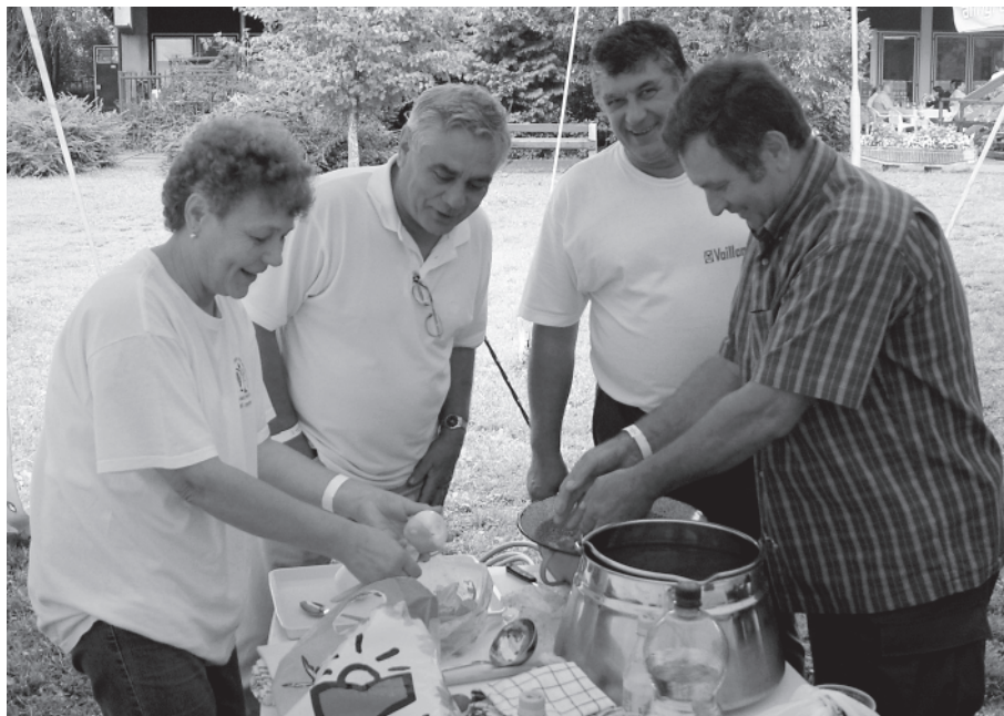
A közgyűlés után „beindultak” a bográcsok

2007-ben is egy bejelentés érkezett, de az ügy kivizsgálása okafogyottá vált, mivel az egyesületi tagtársunk a tagdíj elmaradása miatt kizárásra került a tárgyalást megelőzően. 2008-ban is egy ügy került az Etikai Bizottság elé, melynek eredménye az érintett