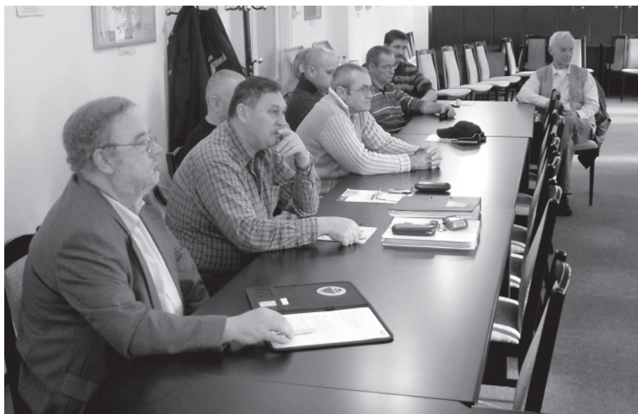
Képünkön a Baranya megyei kollégák a pécsi megyei találkozón