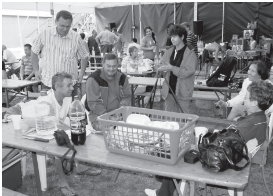
A szabadidős programok között mindig nagy siker a főzőverseny

Az új kódex két jól elválasztható részre tagolódik. Az első leírja az elvárt magatartást általánosságban a megrendelővel szemben, tárgyalja az engedéllyessel való kapcsolatot és a tagok egymással folytatott kapcsolatát, valamint a tag és alkalmazottai viszonyát. A második rész a normák ellen vétőkkel kapcsolatos eljárási szabályokat taglalja. A megküldött változatot az egyesület jogi képviselője megfelelőnek ítélte, az elnökség alkalmas-