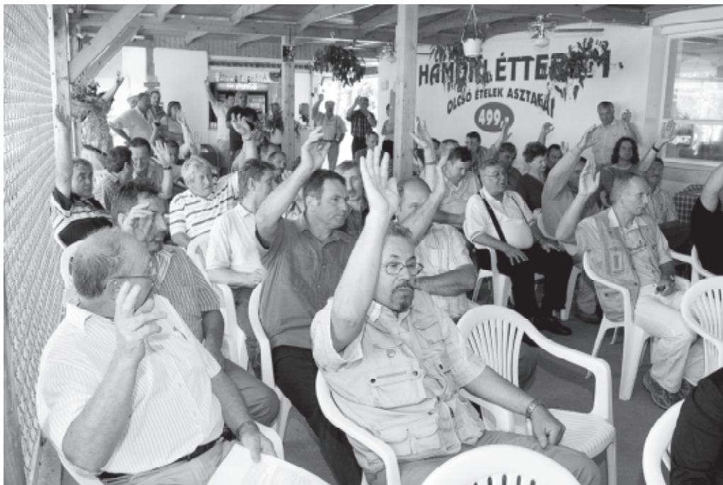
Szavaz a közgyűlés