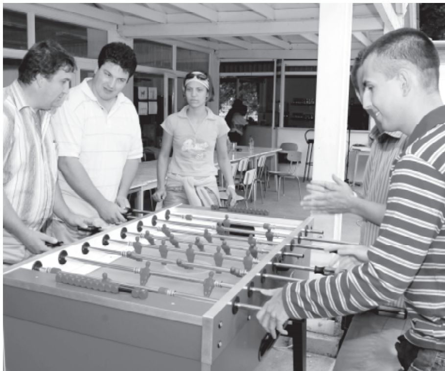
A csocsóbajnokságban kiélezett küzdelem folyt